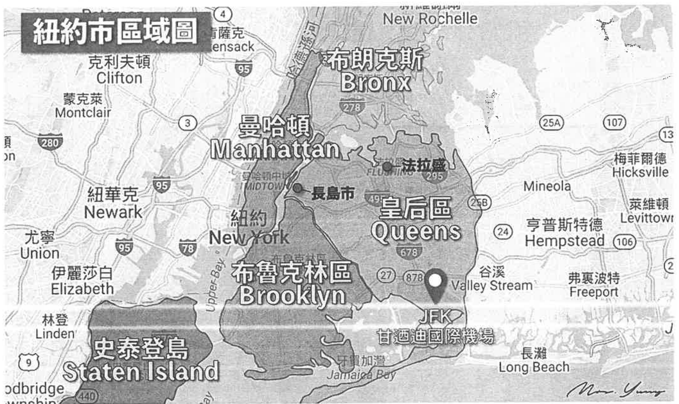
紐約地圖