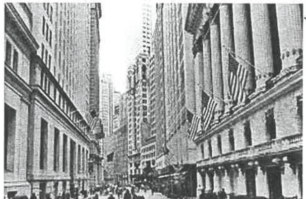
網上圖片： 聯合國總部大樓 (左)、 華爾街 (右)